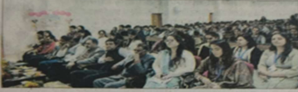
बिलासपुर : शिवा इंस्टीच्यूट ऑफ फार्मसी में आयोजित विशेषज्ञ वार्ता में भाग लेते विद्यार्थी व शिक्षक वर्ग।