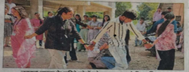
नुक्कड़ नाटक के जरिये लोगों को जागरूक करते विद्यार्थी। संवाद

बिलासपुर। शिवा इंस्टीट्यूट ऑफ फार्मसी बिलासपुर के रेड रिबन क्लब ने एचआईवी/एड्स मरीज के प्रति समाज में भेदभाव के खिलाफ जागरूकता लाने के लिए रैली और नुक्कड़ नाटक का आयोजन किया।