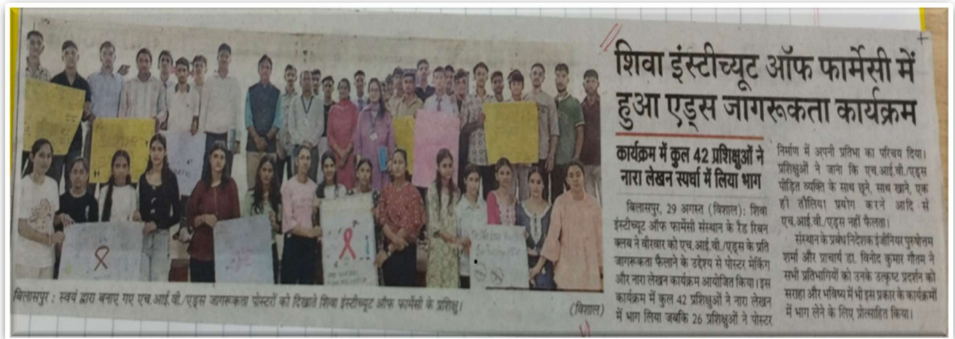
Poster presentation on "AIDS Awareness program" @ SIP