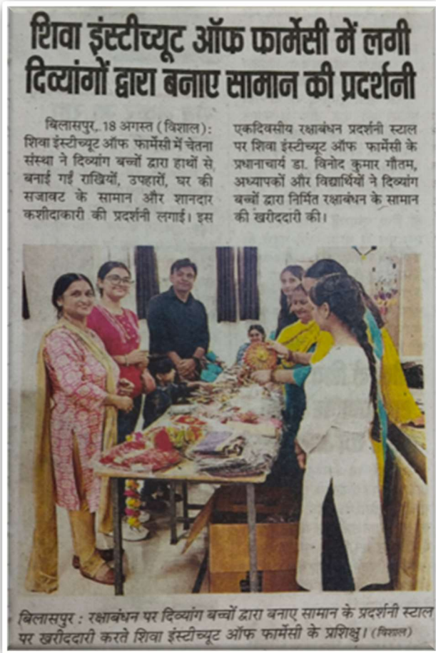
Exhibition on Raksha Bandhan @ SIP