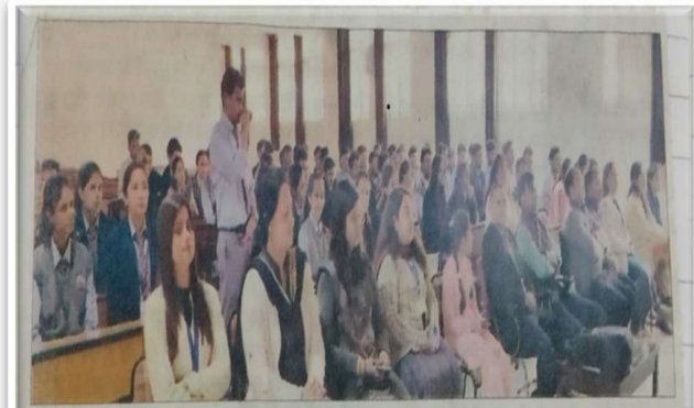
बिलासपुर : शिवा इंस्टीट्यूट ऑफ फार्मेसी में आयोजित उद्योग संस्थान संवाद कार्यक्रम में भाग लेते प्रशिक्षु।