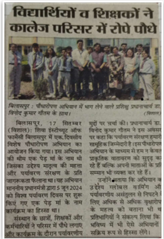
Tree Plantation Program @ SIP