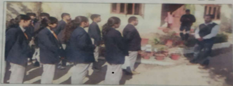
बिलासपुर : शैक्षणिक भ्रमण के दौरान औषधीय पौधों की जानकारी लेते शिवा इंस्टीच्यूट ऑफ फार्मसी के विद्यार्थी।