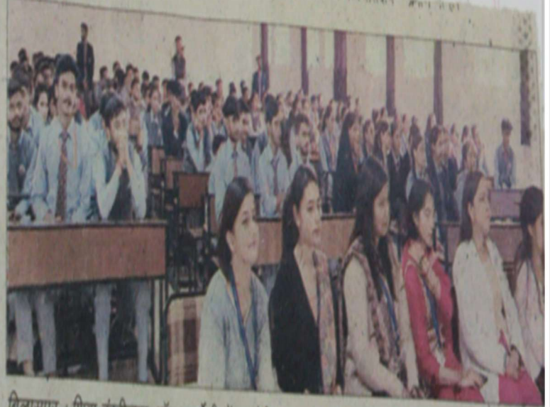
बिलासपुर : शिवा इंस्टीट्यूट ऑफ फार्मसी में आयोजित सतर्कता जागरूकता सप्ताह कार्यक्रम में उपस्थित विद्यार्थी एवं स्टाफ सदस्य।