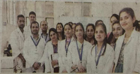
बिलासपुर: शिवा फार्मैसी संस्थान में चल रहे संकाय विकास कार्यक्रम में नवीनतम पेडागोजिकल उपकरणों और तकनीकों से रू-ब-रू हो रहे शिक्षक।