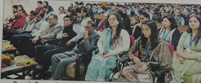
शिवा इंस्टीच्यूट ऑफ फार्मसी बिलासपुर में 63वें राष्ट्रीय फार्मसी सप्ताह पर आयोजित विशेषज्ञ वार्ता में उपस्थित मुख्यातिथि व अन्य।