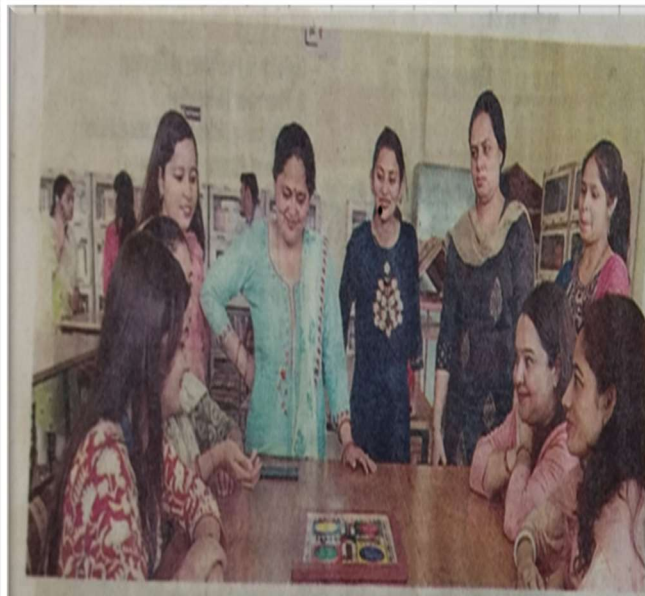
बिलासपुर : शिवा इंस्टीच्यूट ऑफ फार्मैसी में आयोजित टैलेंट हंट प्रतियोगिता में लूडो स्पर्धा में भाग लेते शिक्षण और गैर-शिक्षण कर्मचारी।