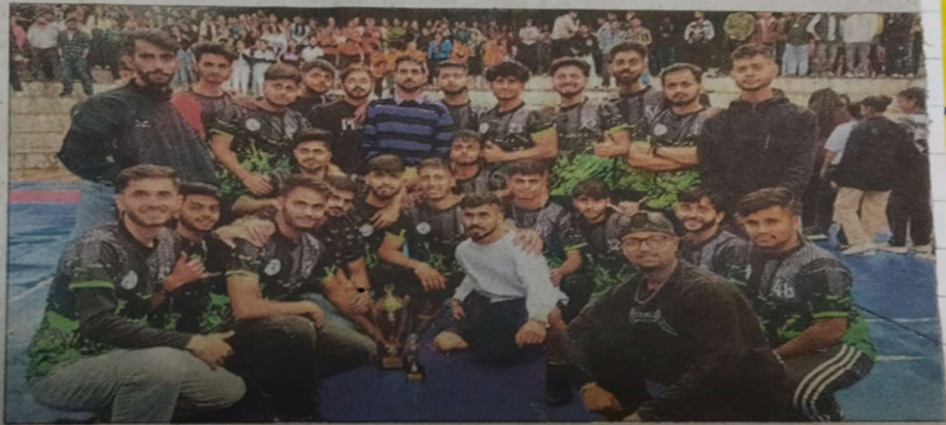
कबड्डी और वॉलीबाल प्रतियोगिता में विजेता शिवा इंस्टीट्यूट ऑफ फार्मेसी के छात्र।